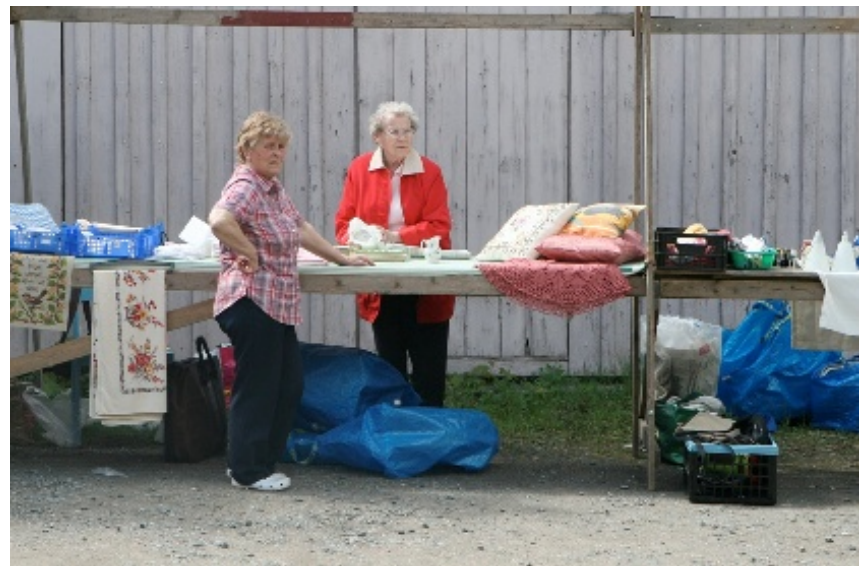
Kommersn höll sig flytande under Kjortelgårdens dag.