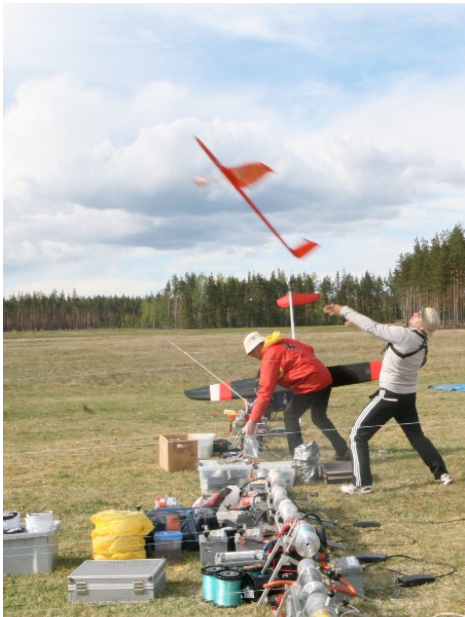
Modellsegelflygplanen kastas upp i luften med hjälp av en vinsch. Det tar bara någon sekund från det att planet kastas upp till att de glider genom luften på över hundra meters höjd.