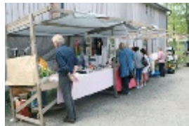
Varor av många olika slag såldes under loppisen.