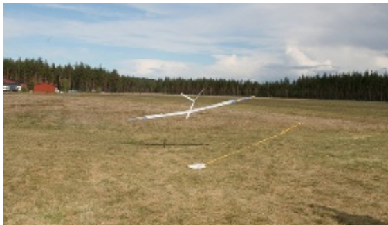
Här landar Joakim Ståhls plan efter ungefär tio minuter i luften. För att få maxpoängen för en flygning gäller det att landa planet efter exakt tio minuter samt att lägga det alldeles intill landningsplattan.